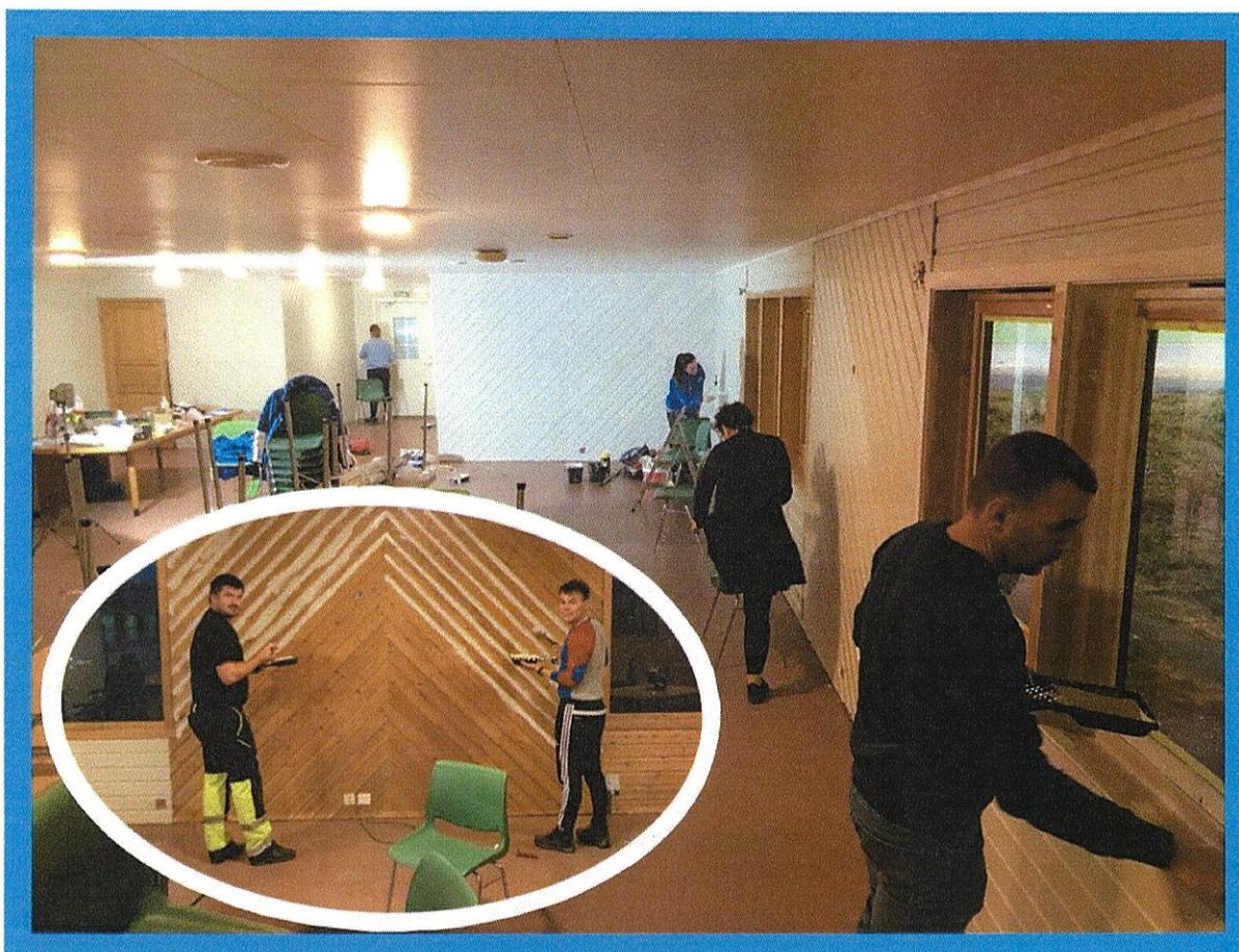
Dugnad på klubbhuset oktober 2020.